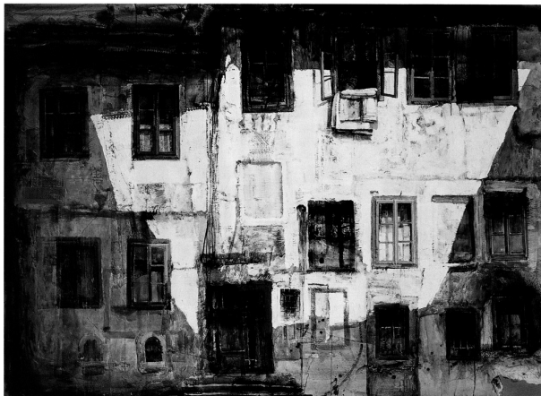
«La facade» 1996/97 aquatinte réhaussée 100 x 135