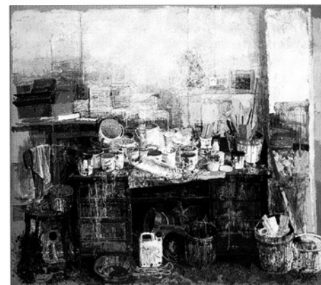
"Atelier", 2003, tempera, papier/toile 180 x 220 cm

Il reste toujours passionné par les arbres auxquels il donne des densités insensées; les vieilles maisons qui l'entourent, qu'il rêve aussi parfois; les fenêtres pauvrement fleuries de maigres géraniums dont la petite tache rouge éclaire toute l'œuvre; les mains implorantes, douloureuses, tragiques ou tendues vers l'espoir; les natures mortes si dépouillées qu'elles en paraissent misérabilistes. Voilà hâtivement présentées ces œuvres fortes, prégnantes, mais toujours infiniment poétiques. La science de la technique s'allie