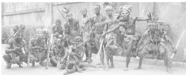
FESTIVAL DE L'IMAGINAIRE, À LA MAISON DES CULTURES DU MONDE.